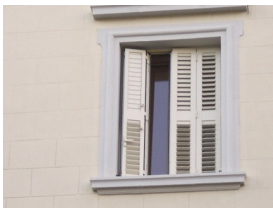
Ayuntamiento Sant Boi de Llobregat